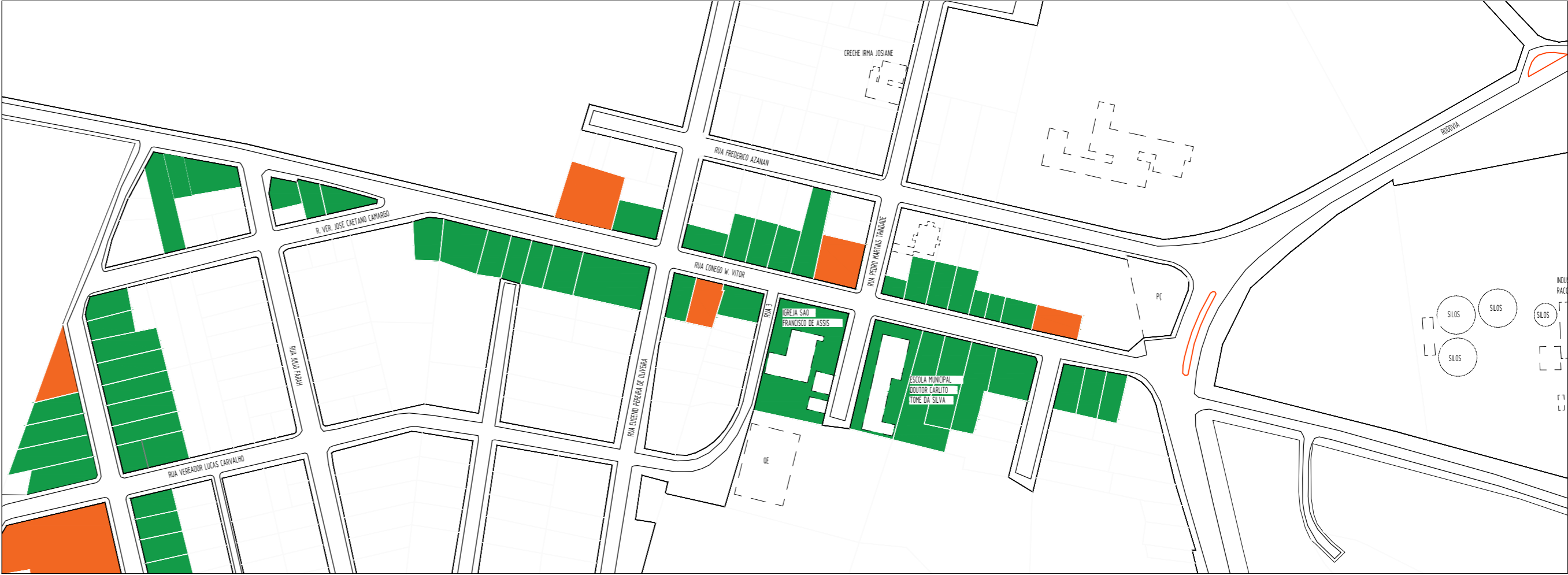
PLANTA DE DENSIDADE (RUA CÔNEGO WENCESLAU VIKTOR) ESC: 1:1000