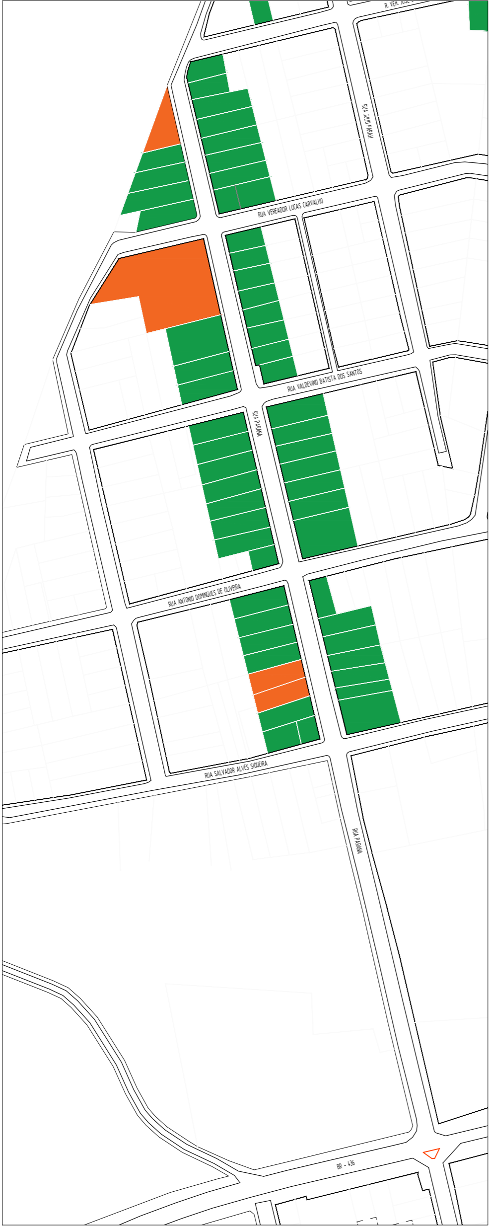
PLANTA DE DENSIDADE (RUA PARANÁ) ESC: 1:1000