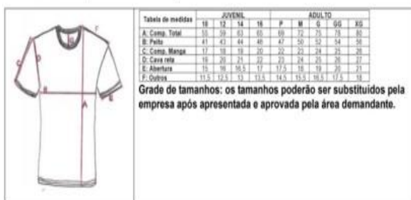
Tabela de medidas para a camiseta manga curta unissex