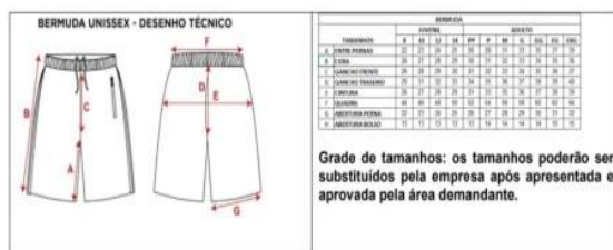
Imagens da bermuda helanca unissex