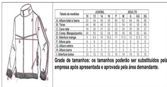
Imagens da jaqueta (conjunto abrigo)